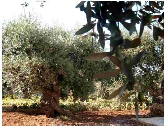
Olivenbaum im Juli

Begriffe wie „Qualitätsstandard“ und „Qualitätssicherung“ gehören in den dort gewachsenen bäuerlichen Strukturen nicht zum alltäglichen Wortschatz. Die harte Handarbeit dieser Bauern auf ihren kleinen Olivengütern und ihre Denkweise belohnen jedoch die Qualität dieses Olivenöls. Das schlägt sich im Geschmack und in der Qualität nieder: Das apulische Olivenöl überzeugt auch ohne Qualitätssiegel.