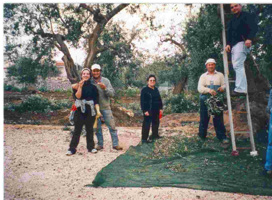
Die ganze Familie hilft bei der Olivenernte

Leider erreicht bislang nur sehr wenig von diesem Öl die Endverbraucher außerhalb Apuliens. Daran sind die Kleinbauer und Landwirte, die wie „besessen“ ihre Olivenbäume hegen und pflegen, zum Teil auch selbst schuld. Sie produzieren fast ausschließlich für den Eigenbedarf und den Kleinhandel vor Ort. Die Familie ist wichtiger als der Absatz. Deshalb sind sie sehr darauf bedacht, nicht zu viel von ihrem Olivenöl zu verkaufen. Die ganze Familie soll immer einen ausreichenden Vorrat fürs ganze Jahr haben. Auf Kaufanfragen von Fremden reagieren sie zurückhaltend und reserviert. Großbestellungen nehmen sie - wenn überhaupt - erst nach langem Überlegen an. Aus diesem Grund nennen Landsleute aus Norditalien diese Kleinbauern scherzend auch „die Verrückten aus Apulien“.