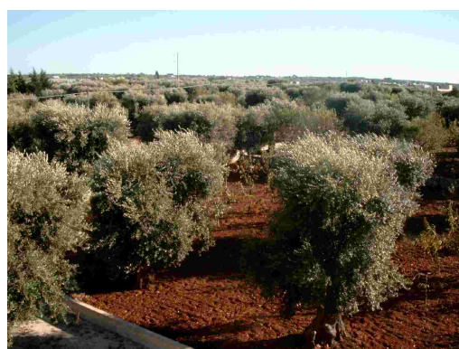
Olivenhain im Sommer

glättet und säubert man die Erde unter der Baumkrone und jätet von Hand das Unkraut. Dafür wird der Platz unter dem Baum wöchentlich mit einem Besen gesäubert und abgefallene Blätter werden entfernt. So verschmutzen die heruntergefallenen Oliven nicht und sind leicht aufzulesen.