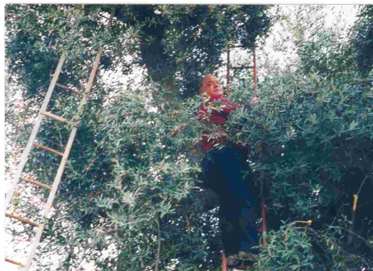
Sommerpflege der Olivenbäume

So wie zu Zeiten der Urgroßeltern, so werden auch heute noch die Olivenbäume von den Kleinbauern bearbeitet.